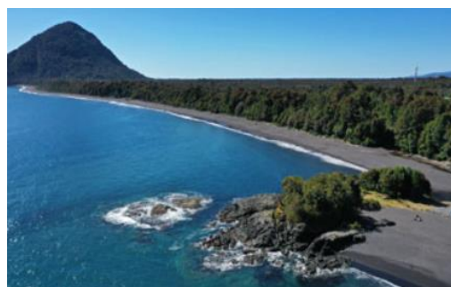
Playa Santa Bárbara

Situada a 12 kilómetros al norte de Chaitén, esta playa ofrece arenas blancas y vistas panorámicas del océano Pacífico, siendo ideal para caminatas y avistamiento de aves (Municipalidad de Chaitén, 2025).