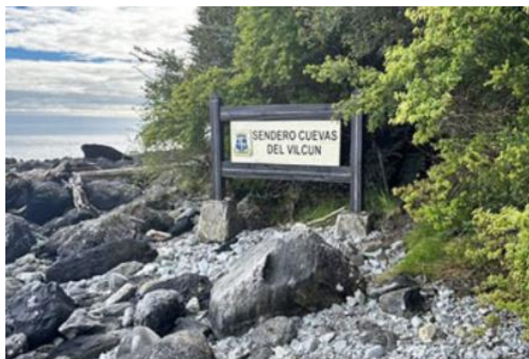
Cuevas de Vilcún

Ubicadas en la playa Santa Bárbara, estas cuevas contienen grabados y pinturas rupestres de la época precolombina, reflejando la rica historia cultural de la zona (Municipalidad de Chaitén, 2025).