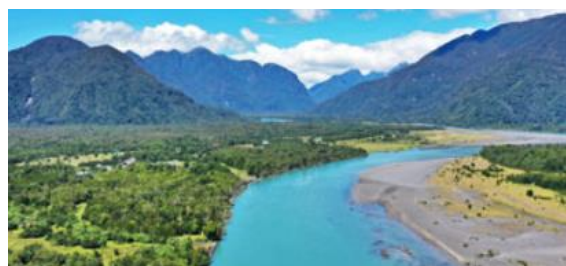
Río Yelcho

Famoso por sus aguas cristalinas. Es un destino imperdible para la pesca deportiva de truchas y salmones. Sus paisajes, rodeados de montañas y bosques, lo convierten en un lugar ideal para la fotografía y el ecoturismo (Municipalidad de Chaitén, 2025).