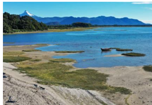
Sector Puntilla (desembocadura del Río Negro)

Es un lugar único donde el río Negro se une con el mar, creando un entorno perfecto para caminatas y la observación de aves, ofreciendo postales inolvidables de la naturaleza chaitenina (Municipalidad de Chaitén, 2025).