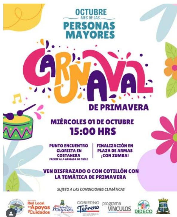
Afiche Carnaval de Primavera

Organizada por la municipalidad, donde los asistentes pueden disfrutar de diversas actividades y espectáculos en vivo (Municipalidad de Chaitén, 2025).