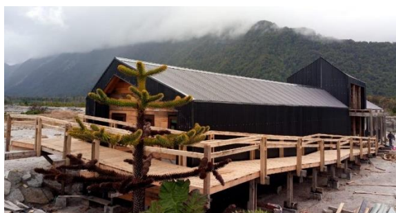
Museo de Sitio

Espacio de memoria del evento eruptivo del 2008 y de puesta en valor de la comuna de Chaitén que busca ser un eje de desarrollo cultural, científico y educativo, que promueva la sostenibilidad y la autonomía territorial. El establecimiento, consolidado bajo la concesión, gestión y administración de Fundación ProCultura, constituye el primer museo de una catástrofe natural en Chile. ( https://short.do/QWX9Jd ).